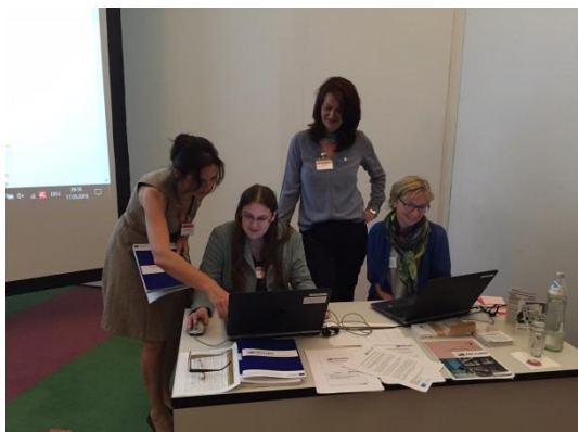
In Graz hatten Bibliothekarinnen und Bibliothekare die Gelegenheit einige der LIB(e)RO-Lerneinheiten selbstständig zu erkunden.

hatten die teilnehmenden Bibliothekarinnen und Bibliothekare die Möglichkeit einer Vorabansicht zweier Lernmodule unserer Plattform ("Mein Europa" und "Einführung in die interkulturelle Kompetenz") und konnten sich selbst ein Bild davon machen, indem sie individuell die Lerneinheiten entdeckten.